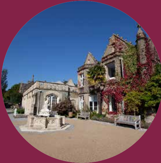
Campws Parc Singleton