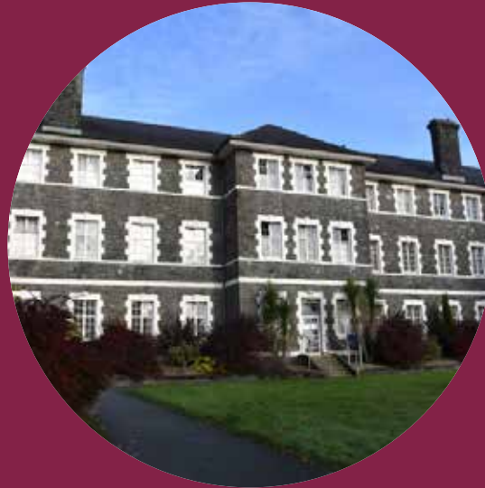
Parc Dewi Sant