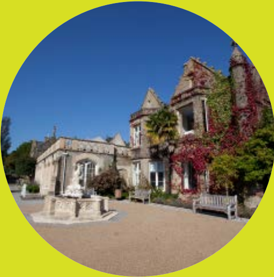
Campws Parc Singleton