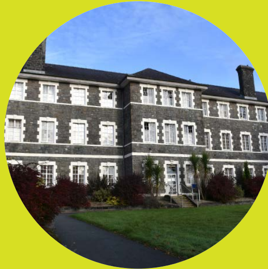
Parc Dewi Sant