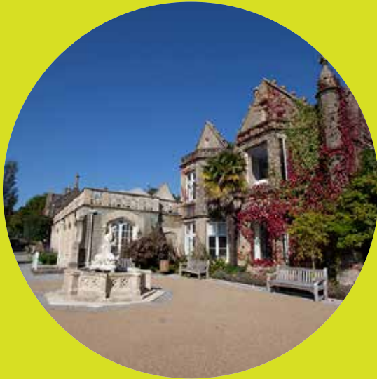
Campws Parc Singleton