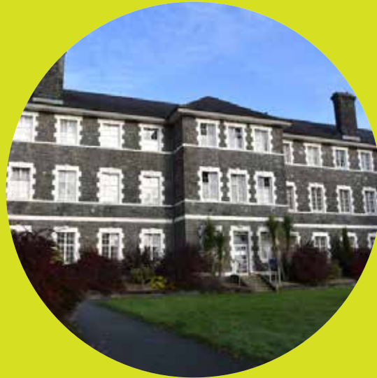
Parc Dewi Sant